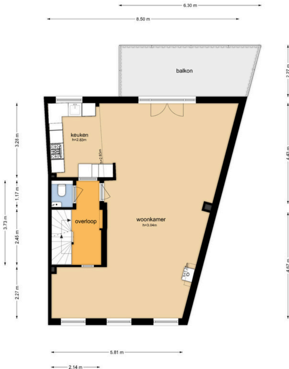
Schouwttjeslaan 29 RD - Haarlem Eerste Verdieping

De plattegronden zijn geproduceerd voor promotionele doeleinden en ter indicatie. Aan de plattegronden kunnen geen rechten worden ontleend.